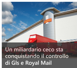
Un miliardario ceco sta conquistando il controllo di Gls e Royal Mail