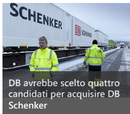
DB avrebbe scelto quattro candidati per acquisire DB Schenker