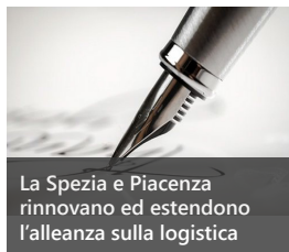
La Spezia e Piacenza rinnovano ed estendono l'alleanza sulla logistica