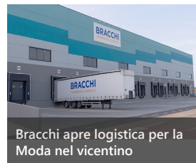
Bracchi apre logistica per la Moda nel vicentino