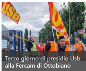
Terzo giorno di presidio Usb alla Fercam di Ottobiano